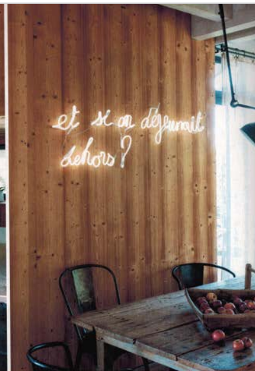
Drapes en lin soft de chez Maison de vacances et jeté de lit Le Loup Philosophe pour la chambre. Autour de la table de vigneron installée dans la salle à manger, chaises Tollix. Au mur, une installation néon d'après l'écriture de la maîtresse de maison. Simplicité et sophistication dans le grand salon où les canapés de Piero Lissoni voisinent avec la table basse Living Divani, Strato. Les baies vitrées sont drapées de rideaux en lin bicolore.